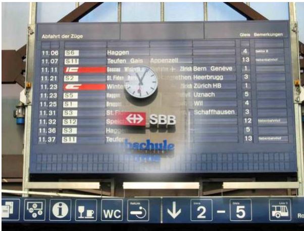
„Wiederkehrendes Bild“ bei kortikaler Sehstörung