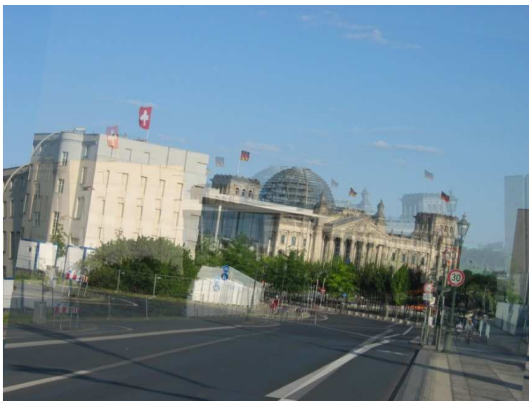
Schräg verkippte Doppelbilder

Die Augenbeweglichkeit ist ein hochkomplexes Geschehen, über das wir uns – solange es funktioniert – keine Gedanken machen. Dennoch ist es nötig, dass wir unsere Augen sehr unterschiedlich bewegen können. Einerseits können wir langsam Dingen nachschauen, andererseits aber auch sehr rasch zwischen Objekten hin und her schauen. Zudem ist es nötig, dass die Augen gezielt miteinander bewegt werden und sie Kopfbewegungen ausgleichen. Auch dass die Augen ruhig in ihrer Position bleiben, nicht abdriften oder zittern ist keineswegs selbstverständlich, sondern wird durch diverse Hirnzentren ständig gesteuert und justiert.