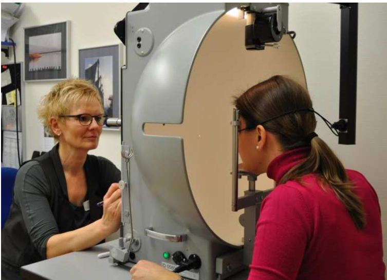
Untersuchung am Perimeter

Das Untersuchungsergebnis gibt Aufschluss über die Ausdehnung des Gesichtsfeldes, allfällige Einschränkungen der Aussengrenzen oder Flecken in der Gesichtsfeldmitte.