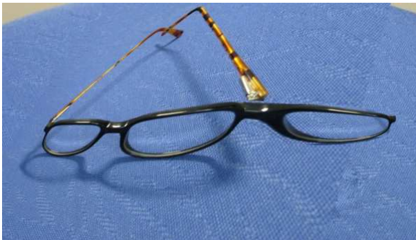
Verzogenes Bild bei kortikaler Sehstörung