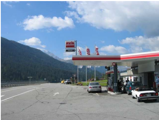
Training mit Alltagsbildern am Beamer